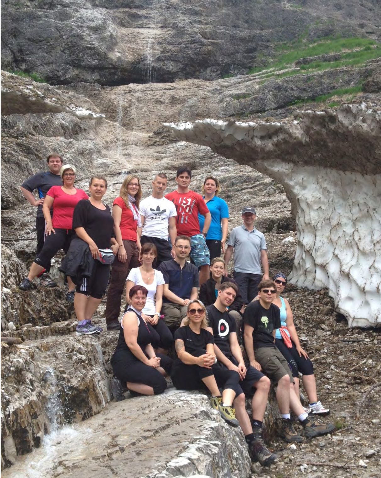
b.it Team Juni 2013, Teamworkshop in Hintersee/Salzburg